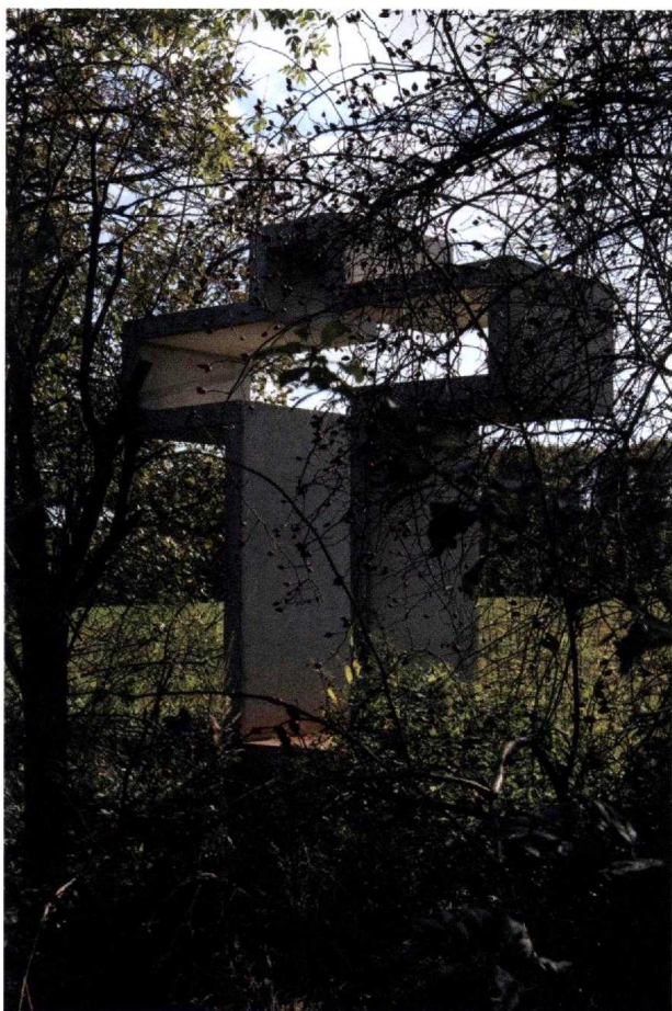
Kříž v krajině.