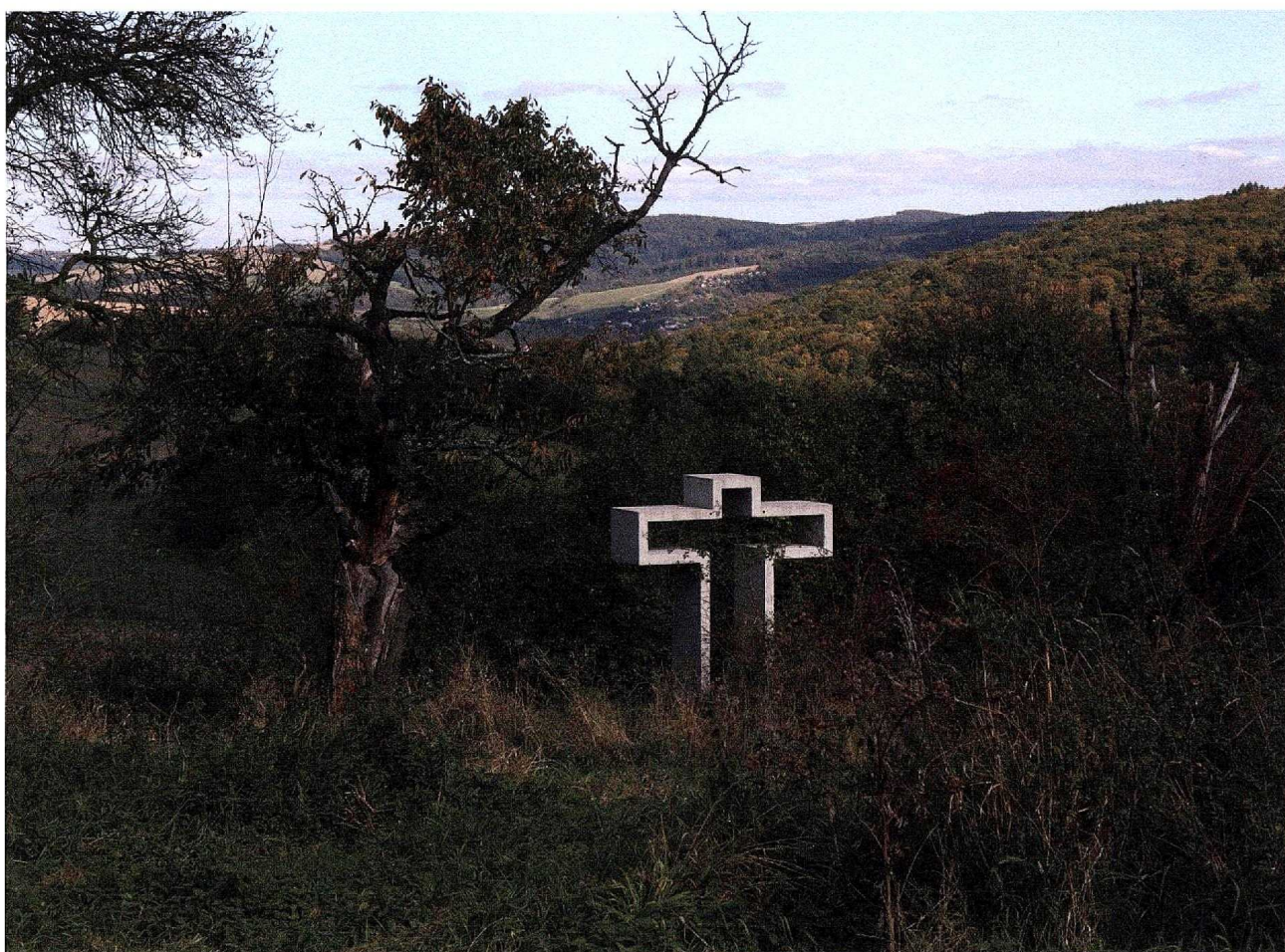
Pohled na kříž v úvalu u Šarov.