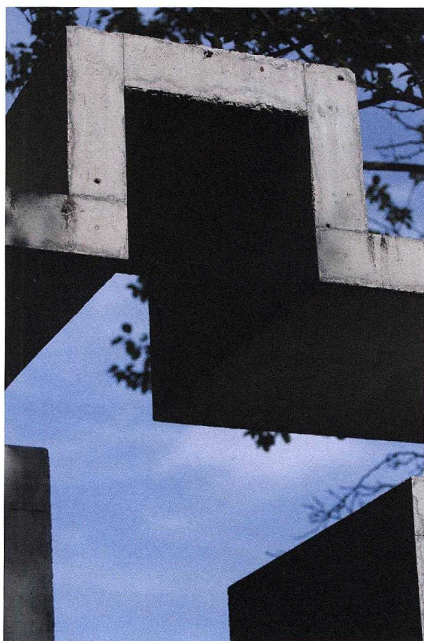
Detail kříže.