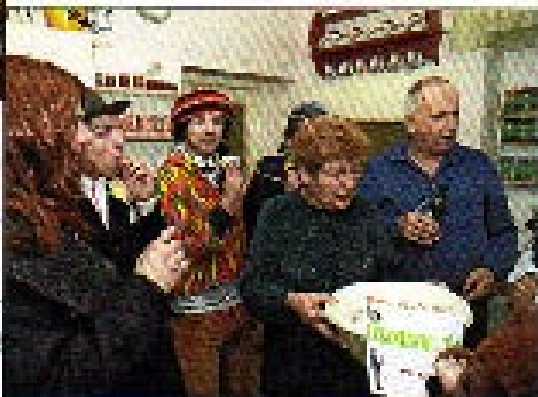
Fašank.